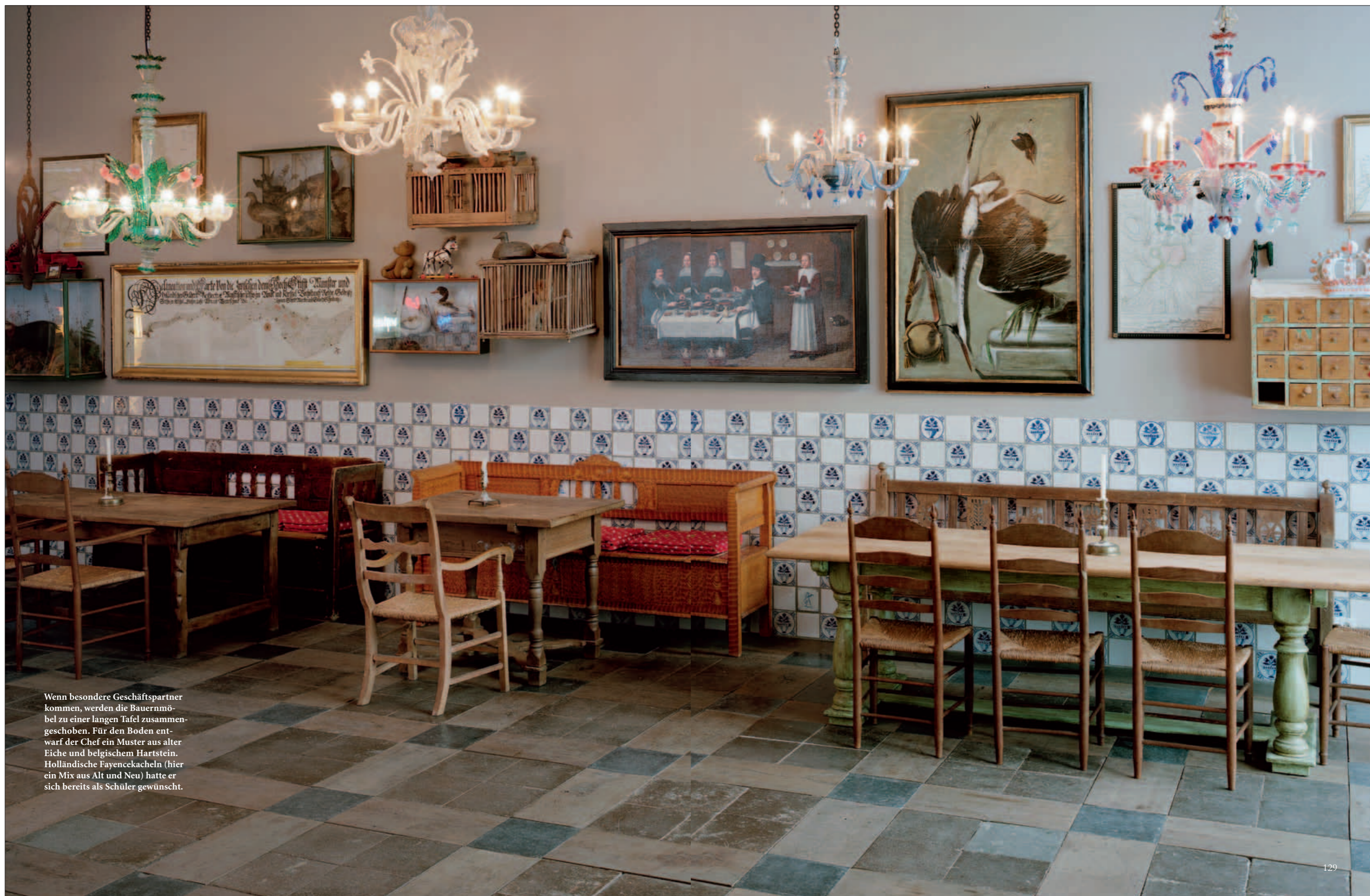
Wenn besondere Geschäftspartner kommen, werden die Bauernmöbel zu einer langen Tafel zusammengeschoben. Für den Boden entwarf der Chef ein Muster aus alter Eiche und belgischem Hartstein. Holländische Fayencekacheln (hier ein Mix aus Alt und Neu) hatte er sich bereits als Schüler gewünscht.