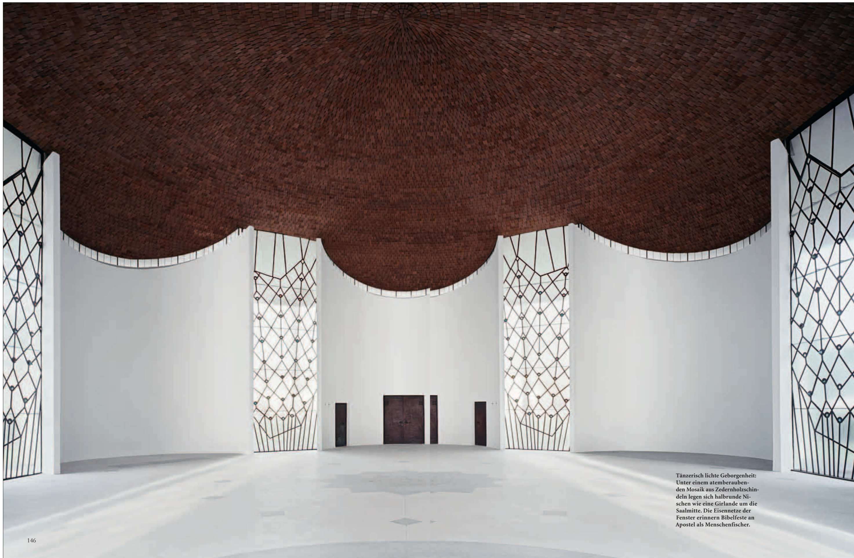
Tänzerisch lichte Geborgenheit: Unter einem atemberaubenden Mosaik aus Zedernholzschin- deln legen sich halbrunde Ni- schen wie eine Girlande um die Saalmitte. Die Eisennetze der Fenster erinnern Bibelfeste an Apostel als Menschenfischer.