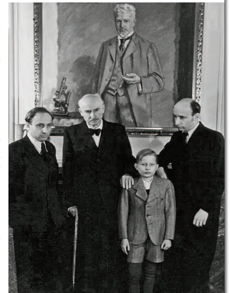
PORTRÄT: ARCHIV KÜHN-LEITZ