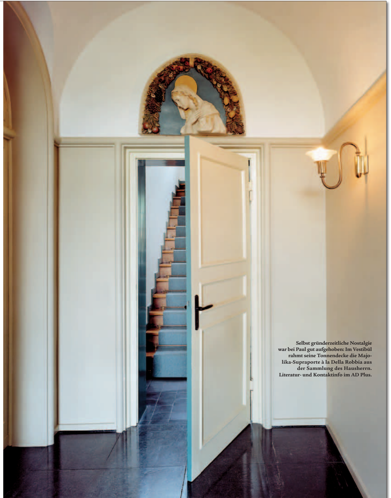
Selbst gründerzeitliche Nostalgie war bei Paul gut aufgehoben: Im Vestibül rahmt seine Tonnendecke die Majolika-Supraporte à la Della Robbia aus der Sammlung des Hausherrn. Literatur- und Kontaktinfo im AD Plus.