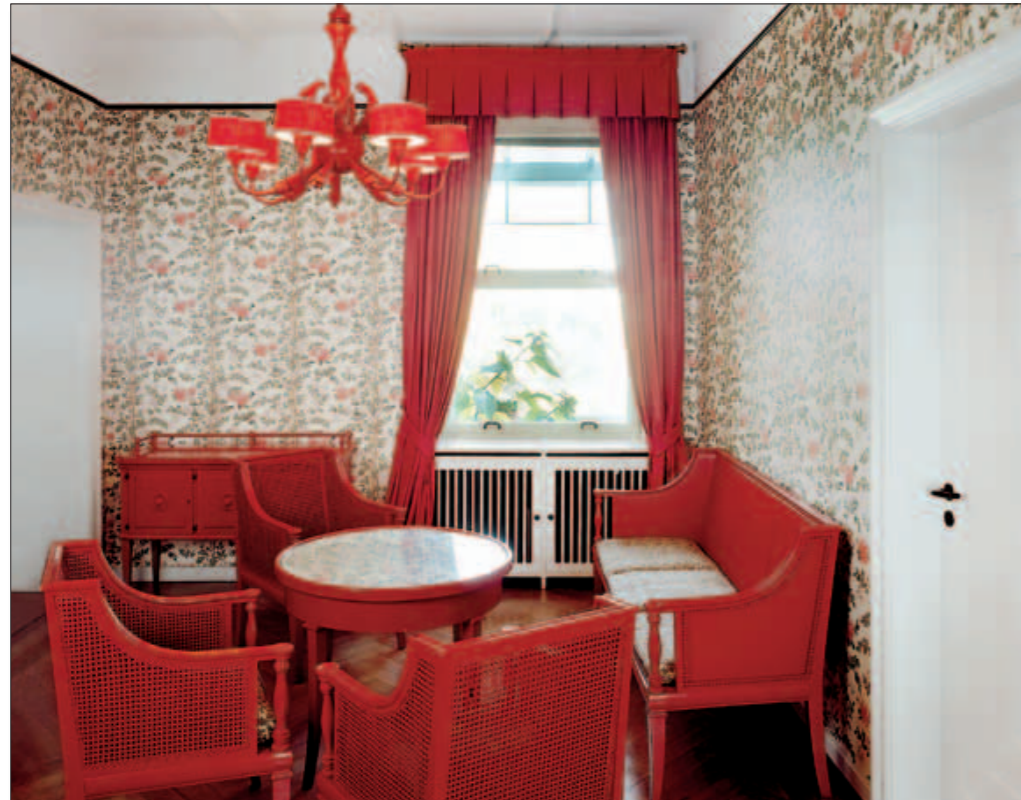
Als „Attacke auf die Stimmung“ beschrieb die Zeitschrift „Deutsche Kunst und Dekoration“ 1921 die Rote Diele in der oberen Etage. Unten das Musikzimmer mit Parkett aus Mooreiche, Mahagoni und Kirschbaum. Beim Mobiliar variierte Paul Formen des Biedermeier.

keit, deren Elemente er aus Ostasienmode, Biedermeier-Nostalgie und geometrischem Jugendstil destillierte.