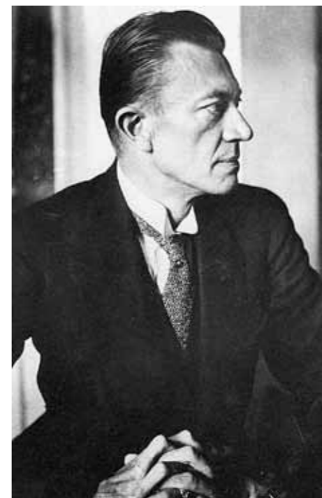
Gut betuchter Visionär: Sein ererbtes Vermögen nutzte Karl Ernst Osthaus, um die Künstlerelite seiner Zeit nach Hagen zu holen.

an der Nord- und Südseite des Hauses. Die Interieurs sind zwar aufwändig mit kostbaren Materialien gestaltet, doch ebenfalls eher auf einen harmonischen Gesamteindruck als auf den augenfälligen Effekt hin komponiert. Die sechseckige Eingangshalle dominiert ein großformatiges Ölgemälde von Ferdinand Hodler, das nicht im Entree selbst, sondern in einem angrenzenden kleinen Empfangssalon hängt. „Der Auserwählte“, entstanden 1903, kniet auf graubraunem Boden, der in eine leuchtend grüne Landschaft übergeht. Vor ihm sprießt ein junges Bäumchen, sechs blau gekleidete Engel umschweben ihn und sein Werk. Das Motiv wirkt wie eine Ermutigung für Osthaus, seinen Visionen konsequent zu folgen. Denn mit dem zarten Bäumchen seiner Kunstsammlung hoffte er, nicht nur die gehobenen Schichten ästhetisch zu er-