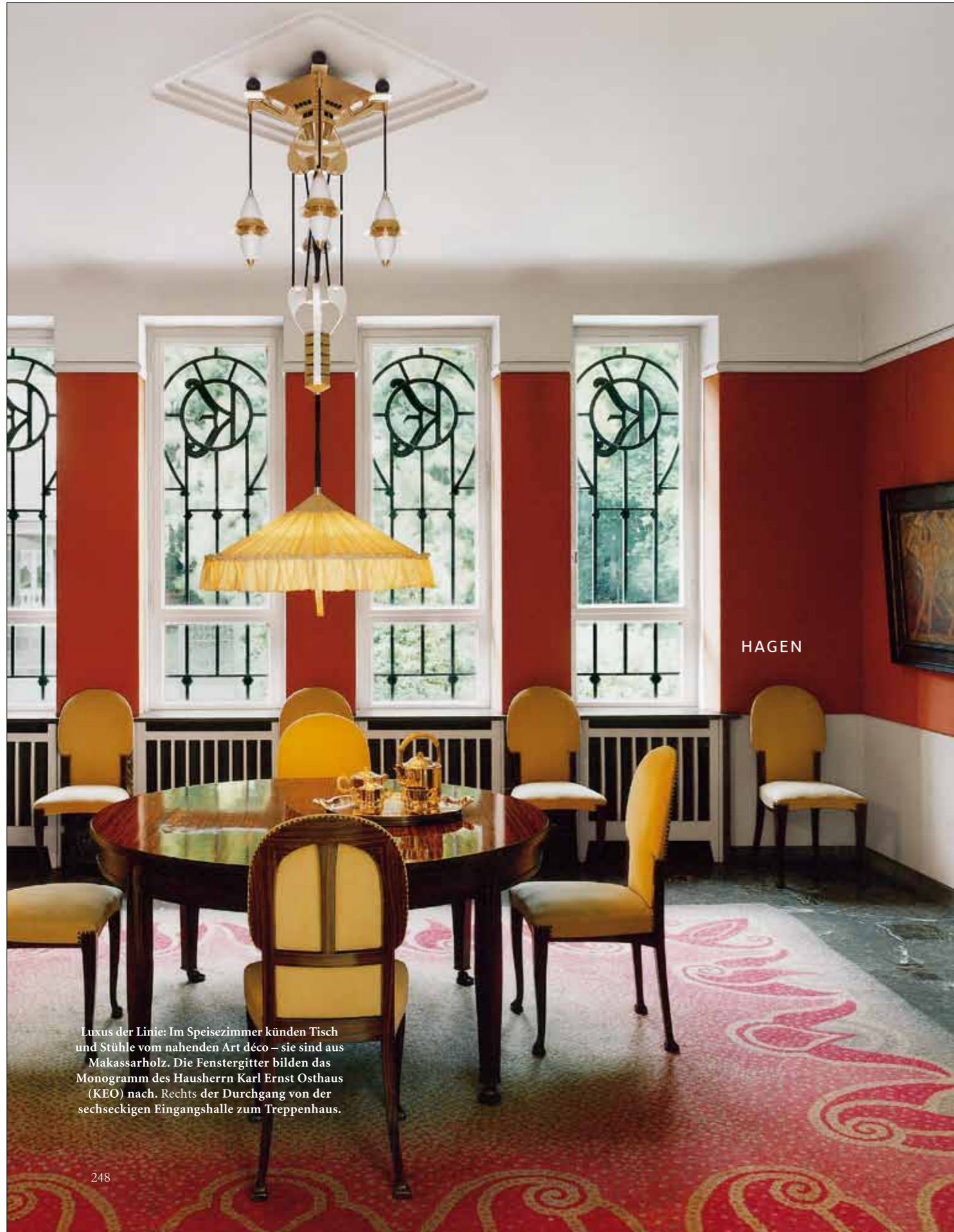
Luxus der Linie: Im Speisezimmer künden Tisch und Stühle vom nahenden Art déco – sie sind aus Makassarholz. Die Fenstergitter bilden das Monogramm des Hausherrn Karl Ernst Osthaus (KEO) nach. Rechts der Durchgang von der sechseckigen Eingangshalle zum Treppenhaus.