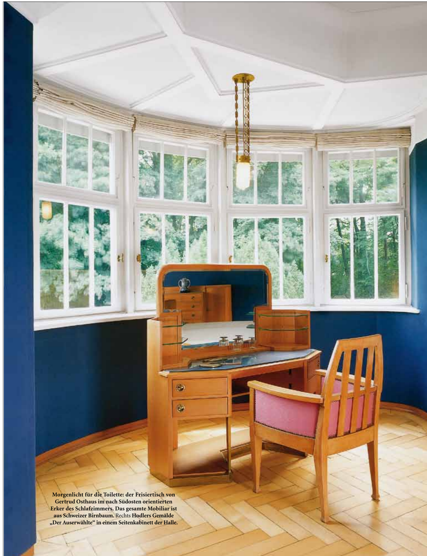
Morgenlicht für die Toilette: der Frisiertisch von Gertrud Osthaus im nach Südosten orientierten Erker des Schlafzimmers. Das gesamte Mobiliar ist aus Schweizer Birnbaum. Rechts Hodlers Gemälde „Der Auserwählte“ in einem Seitenkabinett der Halle.